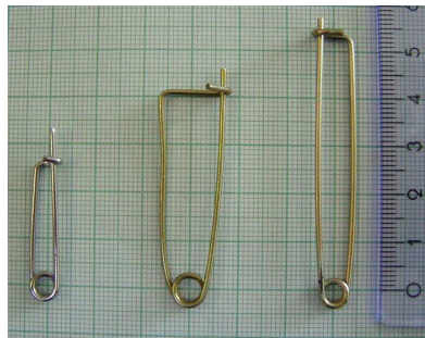
Epingles Fokker 20 mm 35 mm 51 mm

Objet: Epingles de verrouillage “Fokker” des axes d’ailes principaux. Concerne : ULM WT-9 Dynamic (tous numéros de série). Urgence : Avant le prochain vol. Masse et centrage : Masse et centrage inchangés Raison : Possibilité de déverrouillage des épingles de type “Fokker” sécurisant les axes principaux d’ailes, situés dans le cockpit. Mesures : Vérifier le bon verrouillage de toutes les épingles de type “Fokker” utilisées sur le Dynamic. Nous recommandons de remplacer les épingles de type “Fokker” sécurisant les axes principaux d’ailes dans le cockpit et dont la longueur utilisable est 35 ou 51 mm par des épingles dont la longueur est de 20 mm.